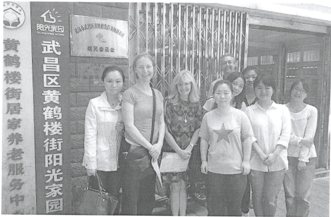
图 3 外方教师在我院实习基地合影