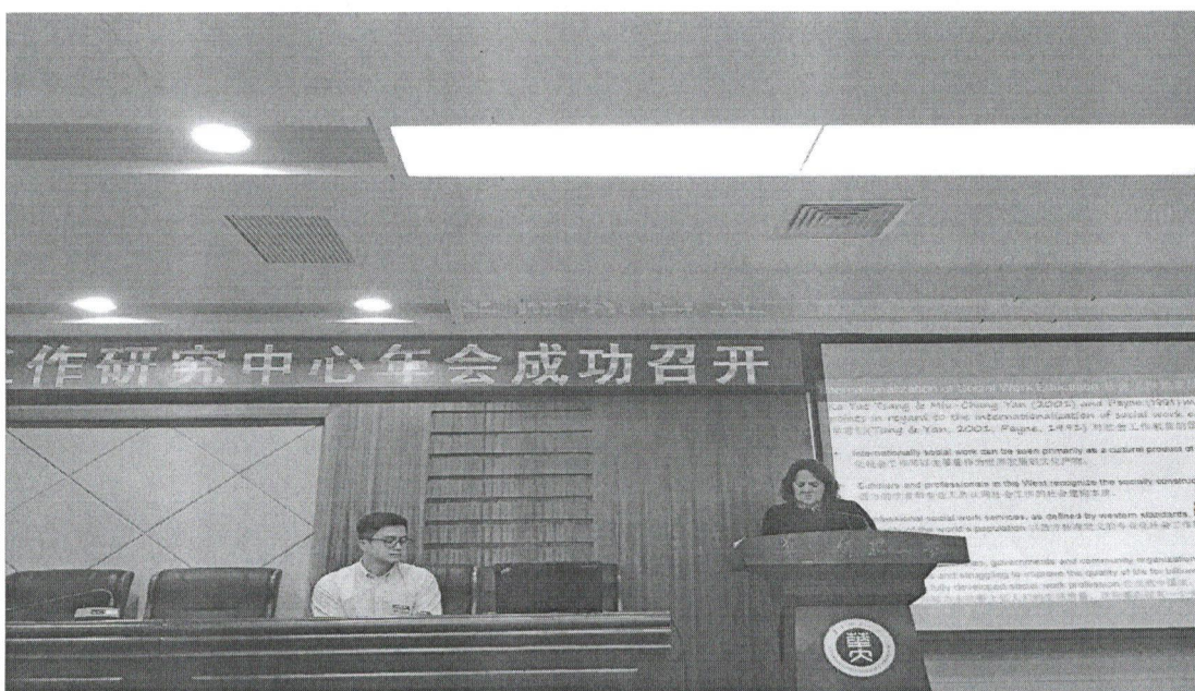
图 7 Lynne Briggs 院长在第二届中澳社会工作研究中心年会上发言